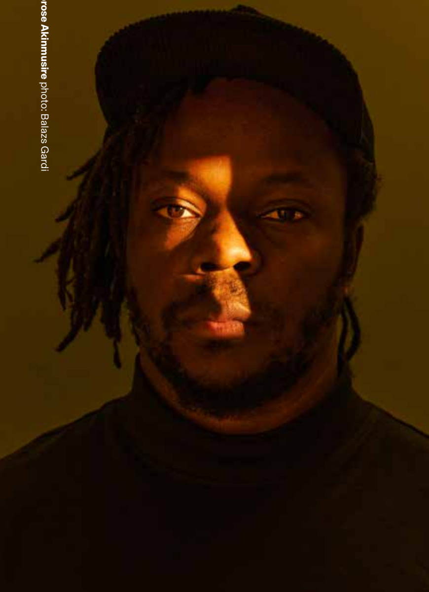
Ambrose Akinmusire