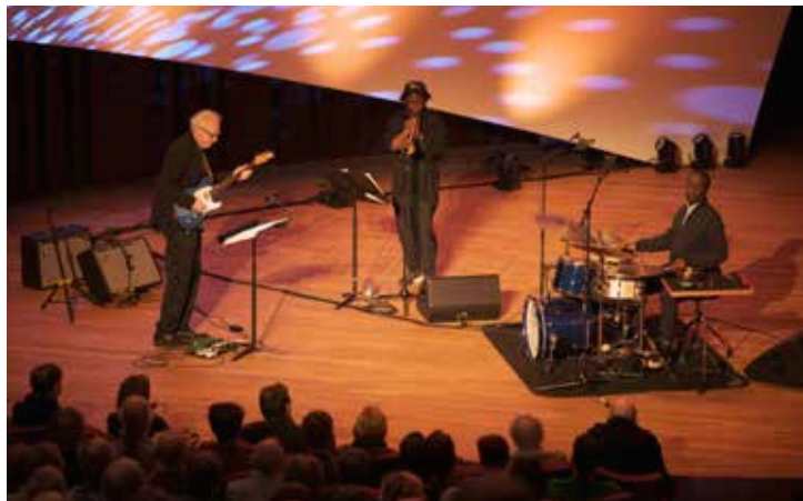
Bill Frisell, Ambrose Akinmusire und Gregory Hutchinson mit «Owl Song», Philharmonie Luxembourg (2024)

dessen vielseitiger Ton zugleich klar, kräftig und strahlend klang, dabei aber in intellektuell afroamerikanischer Tradition verortet blieb. Die Pandemie bremste Ambrose Akinmusire dann wie viele andere Künstler weltweit zunächst aus, sorgte aber auch dafür, dass er neue Betätigungsfelder wie die Filmmusik für sich entdeckte. Er schrieb das musikalische Gewand für die TV-Serie Blindspotting , weitere Soundtracks folgten bereits. Inzwischen ist er zurück in Oakland und wurde neben seinen Arbeiten in Projekten und Turbans als künstlerischer Leiter an das Herbie Hancock Institute of Jazz berufen, das nach einem Streit mit den Erben nicht mehr Thelonious Monk Institute genannt werden darf. Und musikalisch ist er mit dem aktuellen «Owl Song» Projekt mit dem Gitarristen Bill Frisell und dem Schlagzeuger Herlin Riley auf einer neuen Stufe von Klang und Komposition angelangt, die mehr noch als früher ihre Kraft aus der Reduktion und Konzentration der Musik zieht.