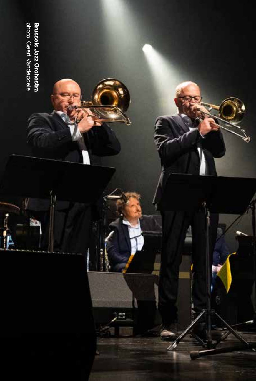
Brussels Jazz Orchestra