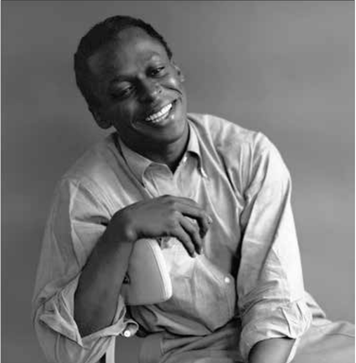
Miles Davis